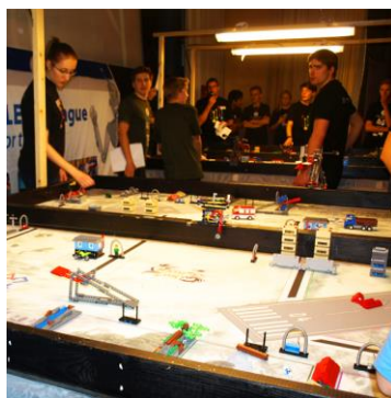
Legobanan redo för robotarna